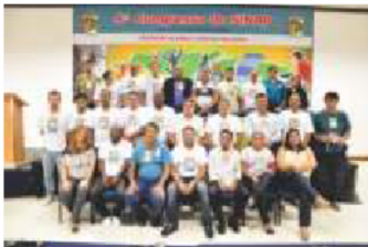
Presidência do SINAP fica na Bahia

Nos dias 3, 4, 5 e 6 de dezembro de 2013, em São Sebastião - SP ocorreu o 4º Congresso do SINAP-Sindicato Nacional dos Papeleiros. A nossa delegação do SINDICELPA juntamente com outras 17 delegações de outros